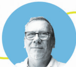
Gilles Mary Travaux Tourisme