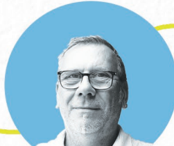
Gilles Mary Travaux Tourisme