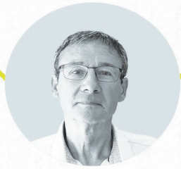
Didier Lemoine Aménagement Environnement Voirie