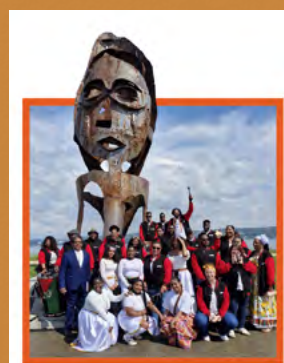
TEMPS DES MÉMOIRES 2026

Le 10 mai : Journée nationale des mémoires de la traite, de l'esclavage et de leurs abolitions.